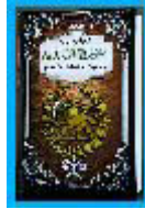
Araz Şəhrili - 50