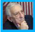
Mayıl Dostu - 24